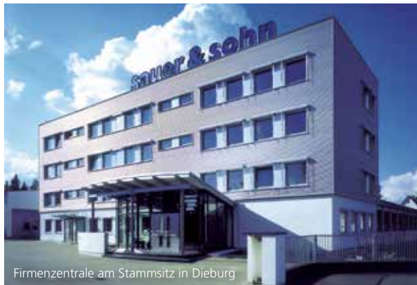
Firmenzentrale am Stammsitz in Dieburg

Tradition ■ Wandel ■ Innovation ■ Nachhaltigkeit